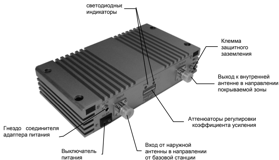
Лицевая панель ретранслятора

На лицевой панели ретранслятора располагаются разъемы для подключения антенных кабелей, соединитель адаптера питания и клавиша выключения питания, светодиодные индикаторы режимов работы и аттенюаторы регулировки коэффициента усиления, а также клемма защитного заземления.