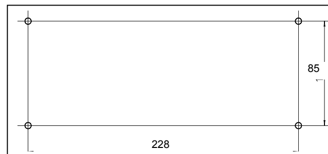
Разметка под отверстия крепления ретранслятора

Ниже представлен эскиз разметки под сверление отверстий в стене для крепления ретранслятора.